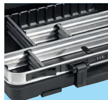
variabilní rozdělení dna kufru hliníkovými přepážkami