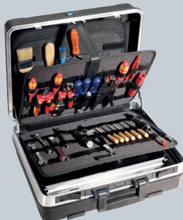
Obj. č. 350 777