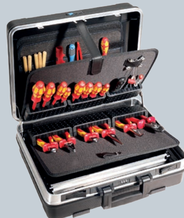
Obj. č. 350 797