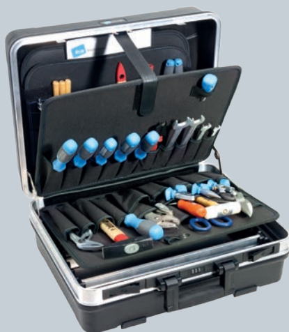
Obj. č. 350 806