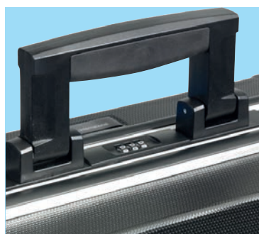
pohodlná, široká rukojeť