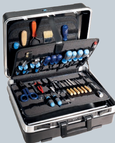
Obj. č. 350 800