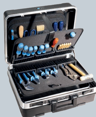
Obj. č. 350 812