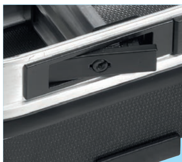
bezpečný kovový zámek