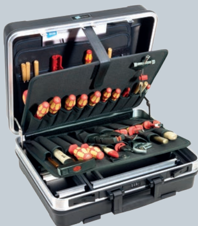
Obj. č. 350 778