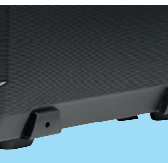
nožičky pro lepší stabilitu